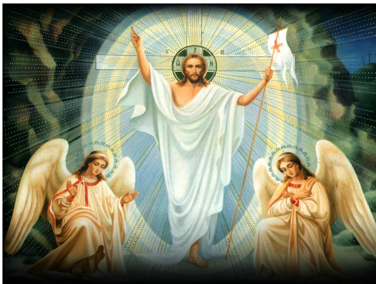
Jesucristo Rey del Universo

Hace mucho tiempo, invité a todas los países del mundo a hacer mucho bien por todos sus pobres, en nombre de nuestro Señor Jesucristo. Pero todos me ignoraron y ninguno me respondió. Quizás no les importan... "Tuve hambre, y no me disteis de comer, tuve sed, y no me disteis de beber; fui forastero, y no me recibisteis; estaba desnudo, y no me vestisteis; enfermo, y en la cárcel, y no me visitasteis". (Mt 25:35-36) En vez de cumplir con la Santa Voluntad de Dios, se han dedicado a negar Su Santa Gloria todo este tiempo. Si el mundo calla, gritarán las piedras.