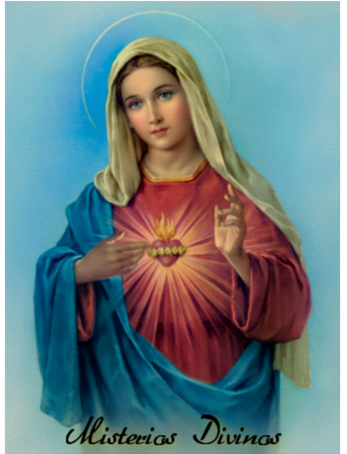
V. La Coronación